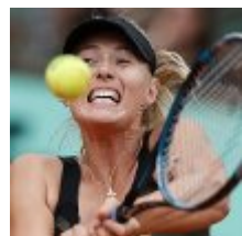
ספורט מריה שראפובה מצטרפת למתנגדי הגניחות