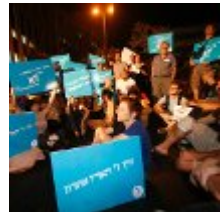
גלריה עובדי "הארץ" משביתים את המערכת משעה 16:00