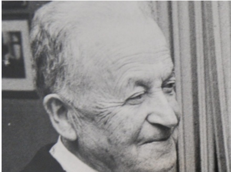
עגנון. קומפקטיות שמחזיקה הכל.