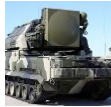
חדשות חרדה מתקיפה ישראלית ב-2008 גרמה לאיראנים לירות...